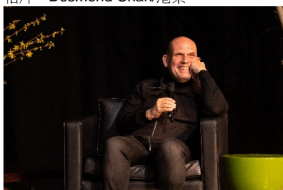
梵志登於鹿特丹音樂前分享