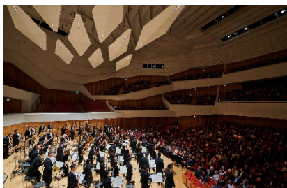
德累斯頓