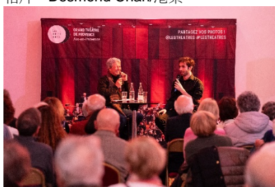
康特洛夫於普羅旺斯艾克斯音樂前分享